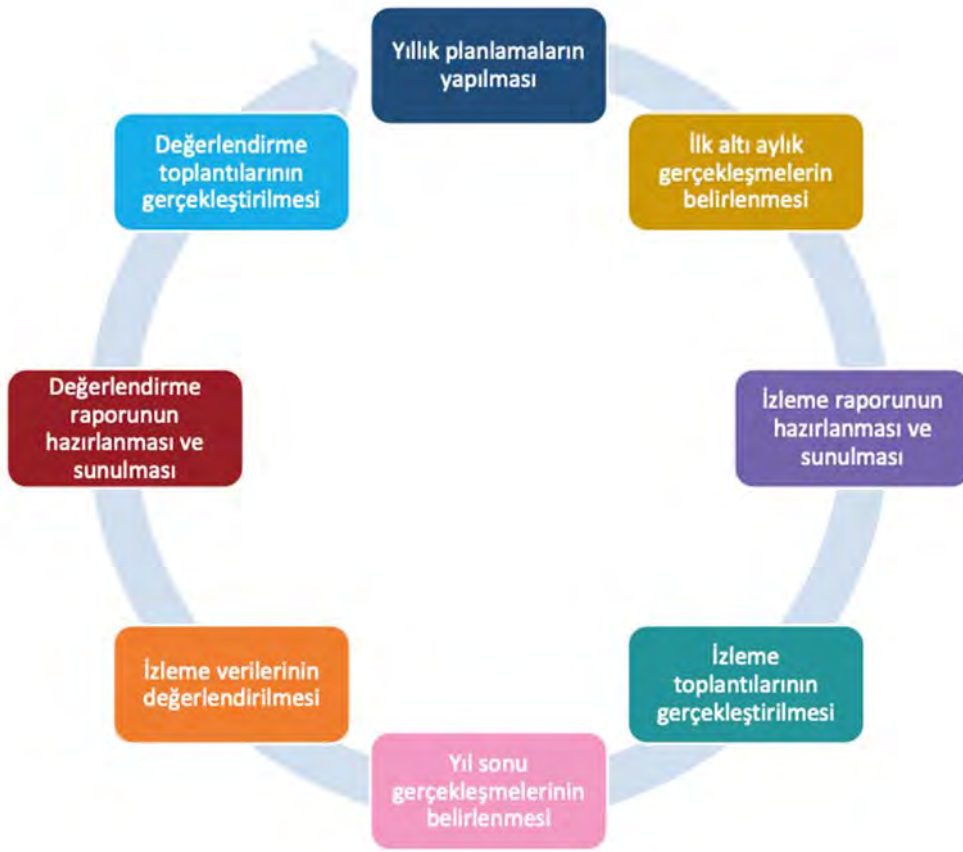
řekil 3. İzleme ve Deęerlendirme Süreci

řehit Haydar Arslan İlkokulu/Ortaokulu Müdürlüęü, 2024–2028 Stratejik Planı’nda yer alan performans göstergelerinin gerekleřme durumlarının tespiti yılda iki kez yapılacaktır. Stratejik planda yer alan amaç ve hedeflere ulaşılması Strateji Geliřtirme Kurulu ve Stratejik Plan Ekibinin sorumluluęundadır.